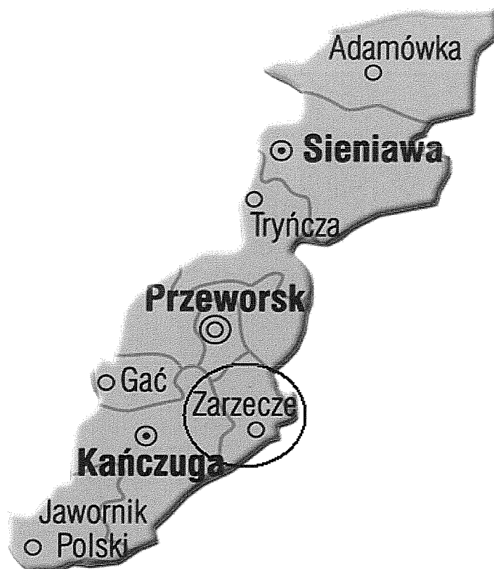
Rys Nr 2. Lokalizacja gminy na terenie powiatu przeworskiego

Pełnaticze są oddalone od siedziby powiatu – Przeworska o 9 km.