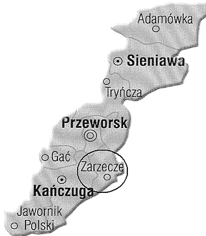
Rys Nr 2. Lokalizacja gminy na terenie powiatu przeworskiego

Kieselów jest oddalony od siedziby administracyjnej gminy – Zarzecza o 1 km, a od siedziby powiatu – Przeworska o 11 km.